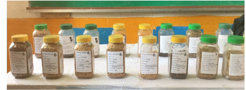
धानका विभिन्न जात