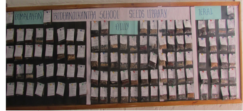
कृषि जैविक विविधता -हिमाल, पहाड र तराईका प्रमुख बालीका बिउहरू