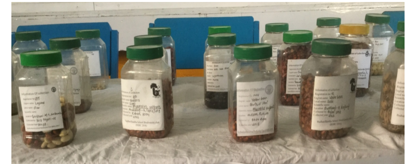
विभिन्न किसिमका गोडागुडी